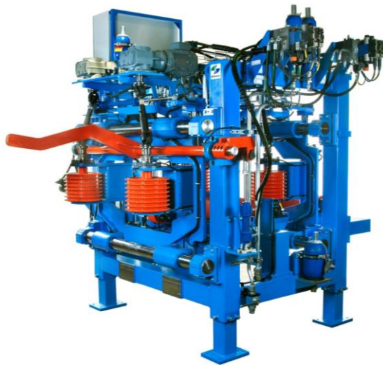
CI-300S Före blockreducerare

Används för 2 sidigt reducerat block, placeras före reducerare för optimering av bästa inläggning av tvåsidigt reducerat block. CI-300S hanterar Asymmetrisk inläggning kombinerat med aktivkurvföljning utifrån en 3D skanners optimeringsresultat.