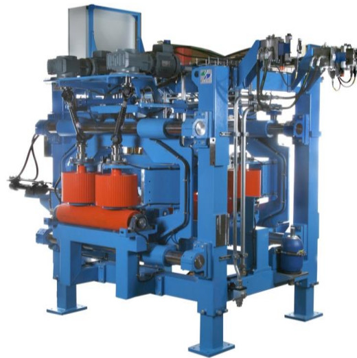
CI-300C Före blocksåg

Används för 2 sidigt reducerat block, placeras före reducerare för optimering av bästa inläggning av tvåsidigt reducerat block. CI-300S hanterar Asymmetrisk inläggning kombinerat med aktivkurvföljning utifrån en 3D skanners optimeringsresultat.