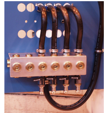
Anslutningar på baksidan